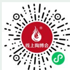
线上陶博会小程序